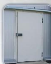
Hengslet dør med tosidig ramme.