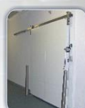
Skyveport med tosidig ramme.